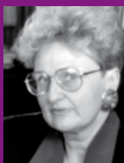
Ewa Łętowska 1987-1992